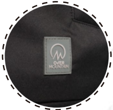
ETIQUETA MARCA PU